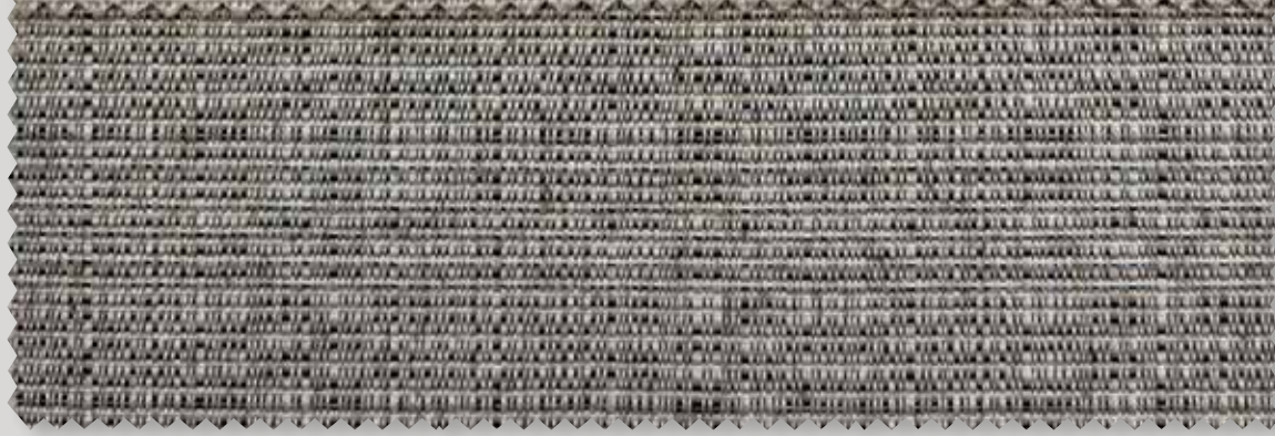
6008 SIESTA 8005