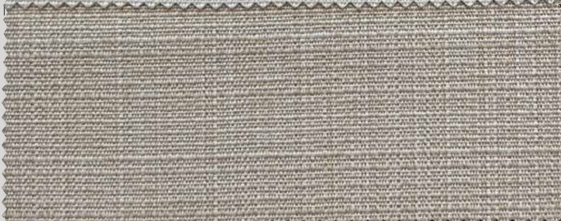
6007 SIESTA 8005