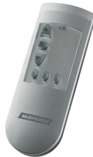
1 kanal sender